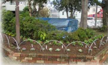
浅間台みはらし公園